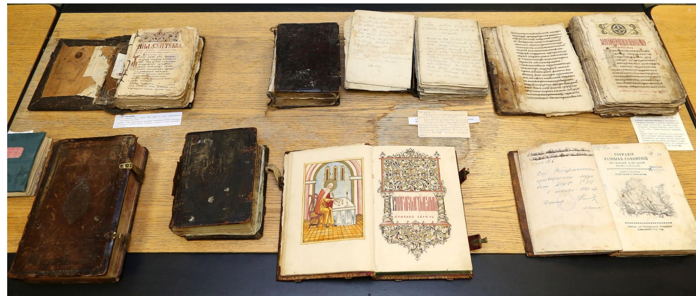
Иллюстрации взяты в некоммерческих целях