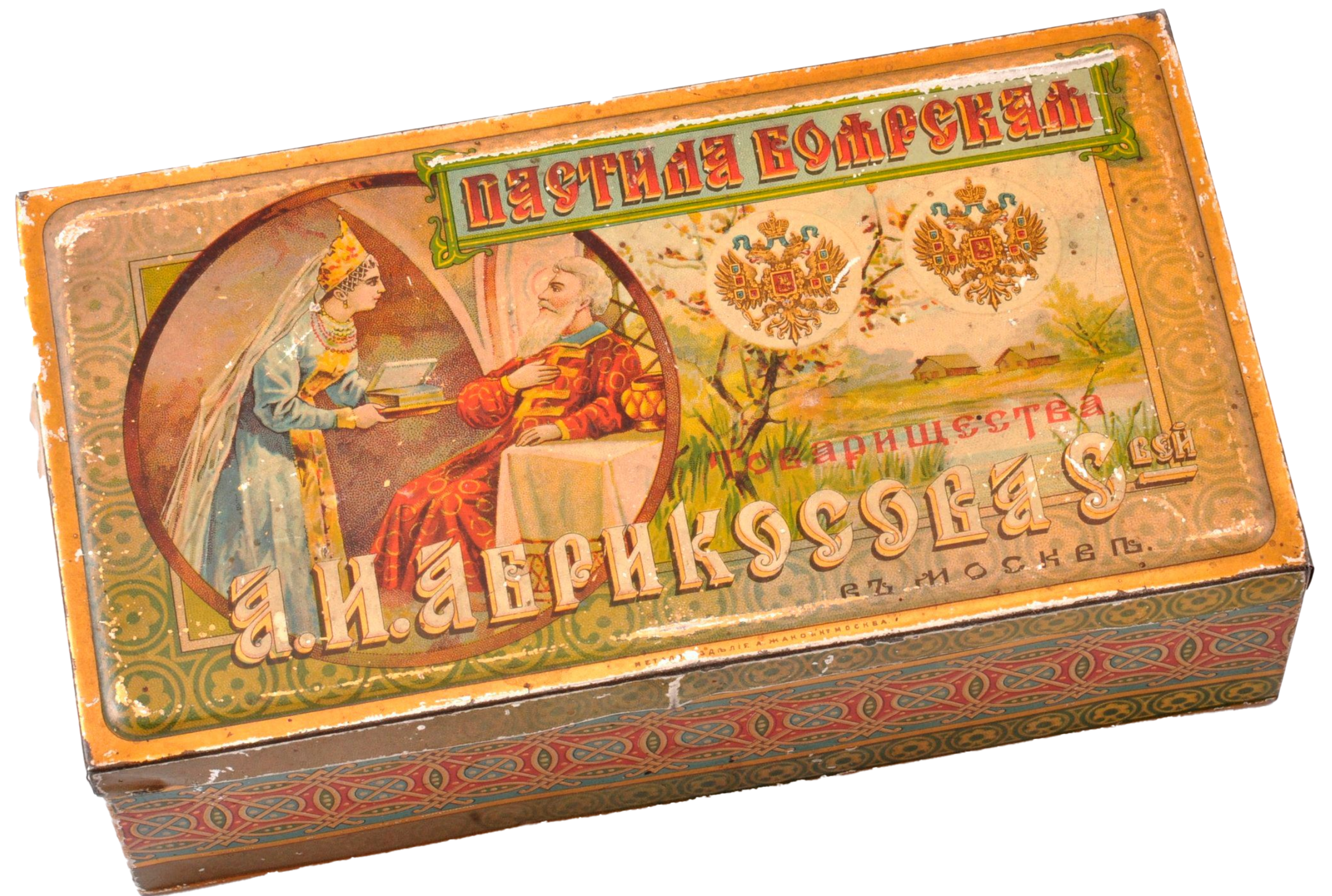
Иллюстрации взяты в некоммерческих целях